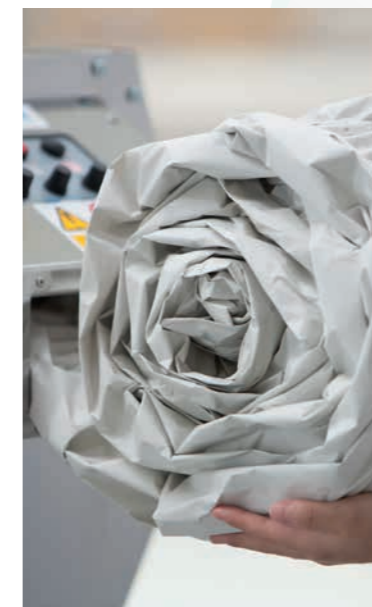
Die Papierpolster bieten extrem hohen Schutz.