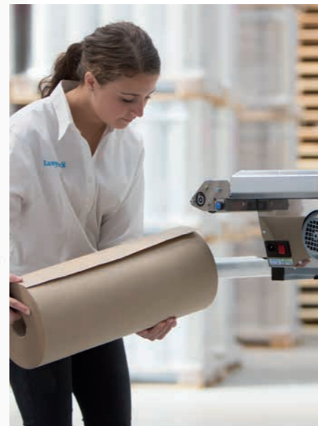
30-Sekunden-Papierbeladung sorgt für mehr Geschwindigkeit und Effizienz.