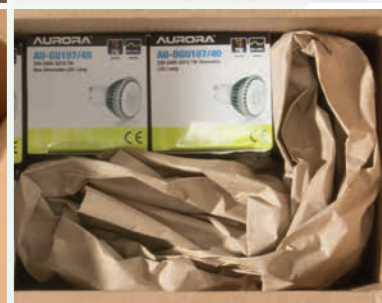
Wenig Lagerfläche: Das Volumen jeder einzelnen Papierrolle wird auf das 60-Fache vergrößert.

packmate® ist ein flexibles, benutzerfreundliches System zur robusten und nachhaltigen Hohlraumfüllung